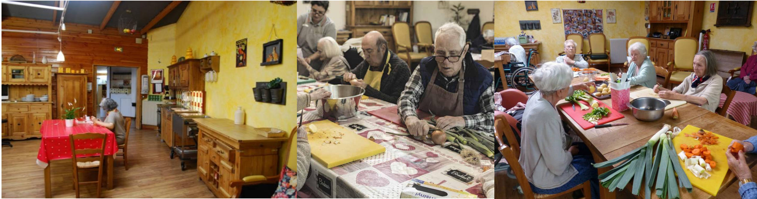
Maison de retraite Protestante –Montpellier